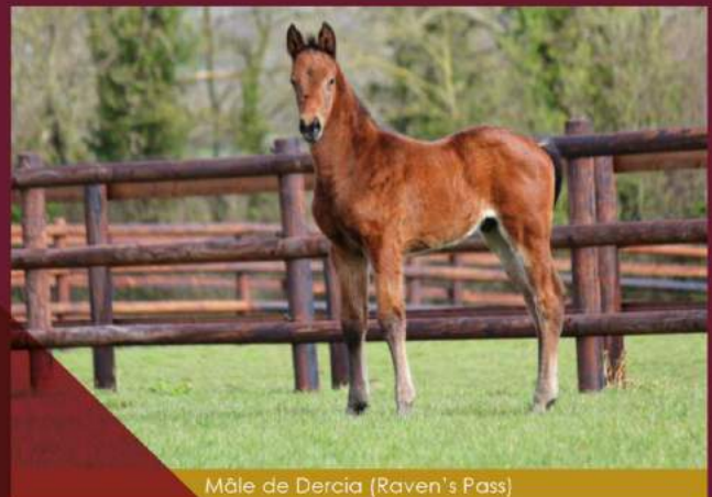
Mâle de Dercia (Raven's Pass)

« Ce sont des poulains avec du volume, de l'os, plus de physique que leur père qui est assez typé Deep Impact. Ils ont de belles têtes et se montrent très toniques. »