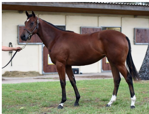
Lot 227, N (SIYOUNI/SHINABAA)