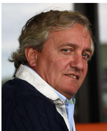
Marc-Antoine Berghracht - MAB Agency

Le trio des top acheteurs est identique à 2014 avec en tête MAB Agency (9 lots pour un total de 289.000 €), suivi de Jean-Claude Rouget (8 lots pour 278.000 €) et Con Marnane (9 lots pour un total de 219.000 €).