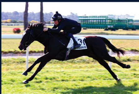
CATH HOCHÉ (SOLDIER'S CALL)